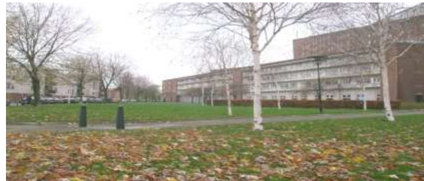
Het bergwegplantsoen naast Humanitas. Nu een grasveld, straks ook een buurttuin!

Lokale voedselproductie is een belangrijk onderdeel van de omschakeling naar een meer duurzame manier van wonen, werken en leven. Door het verbouwen van eten in onze eigen achter- of voortuin (of in het plantsoen) worden we minder afhankelijk van kwetsbaar lange aanvoerlijnen, gaat ons energiegebruik en onze CO 2 -uitstoot flink omlaag én het is ook gewoon leuk om samen met anderen lekker buiten bezig te zijn. Transition Town Rotterdam Noord* zag in het grasveld naast Humanitas een uitgelezen plek om een buurttuin te creëren.